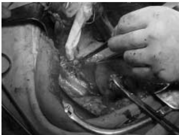
Figura 1. Identificación mediante sonda gamma del ganglio centinela

Equipo 2: simultáneamente a la cirugía oncológica, este equipo talló un bolsillo subcutáneo mediante una incisión longitudinal de 2 centímetros en la cara interna del tercio superior del brazo. Recibido el ovario izquierdo se procede a la decorticación, que se realizara bajo líquido de transporte RPMI 16-40 más albúmina humana a 10%, a efectos