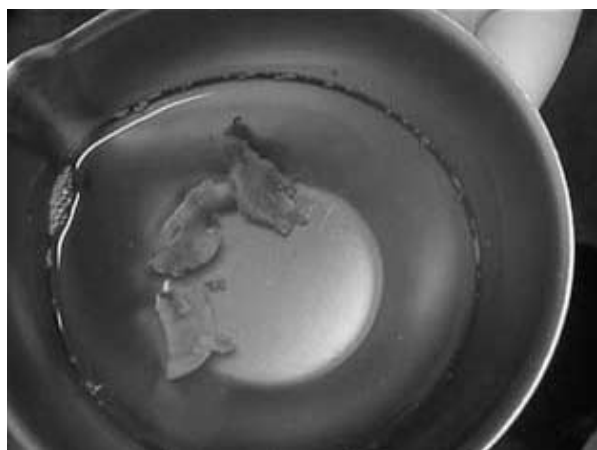
Figura 2. Piezas de ovario decorticado a implantar en el subcutáneo

Seguimiento. El protocolo de seguimiento prevé un seguimiento estructural por medio de ecografía doppler (cabecal de 7,5 MHz) y un seguimiento funcional con dosificación de hormona folículo estimulante (FSH), a partir de los 60 días y luego en forma mensual.