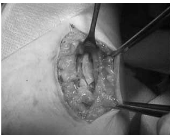
Figura 3. Piezas de ovario decorticado implantadas en el subcutáneo