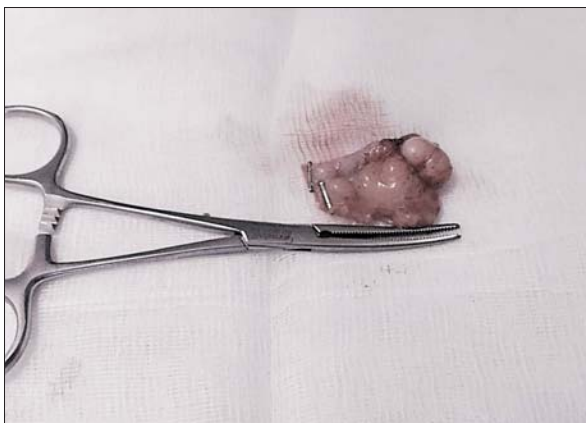
Figura 1. Pieza de apendicectomía.